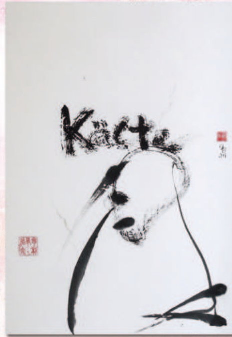
Adaption zu Heinrich Böll: „Kälte, Schmutz, Elend“

aus: „Man möchte manchmal wimmern wie ein Kind“ Tagebücher aus dem Krieg, Köln, 2017